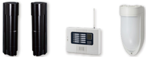
※LoRa はセムテック社の登録商標です

屋外における電波到達距離見通し「約1km」の長距離型ワイヤレスシステム!送信機は、赤外線センサーTLX-125D、屋外・屋内用パッシブセンサー「TLX-127W/N」、防水型接点入力送信機「TLX-102WR」、押ボタン防水型送信機「TLX-113」などをラインナップ。工場や施設など、屋外で広域の非常・防犯・設備監視に最適です。また、コンバータ「RTLX-350」を使用することで、既存の小電力型ワイヤレスシステムの拡張としてもご利用いただけます。