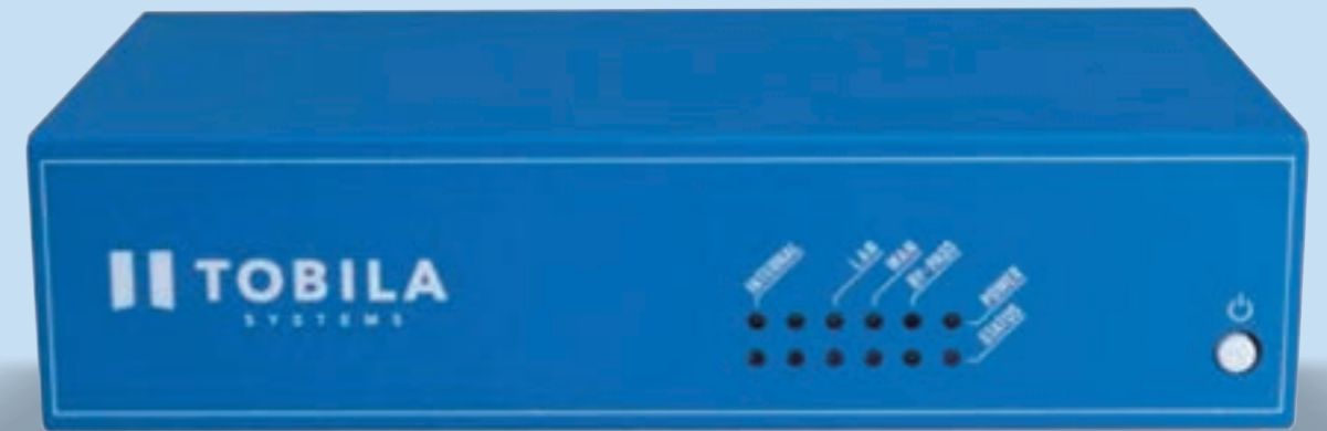
光回線用 TBA-1010A ※特許取得技術